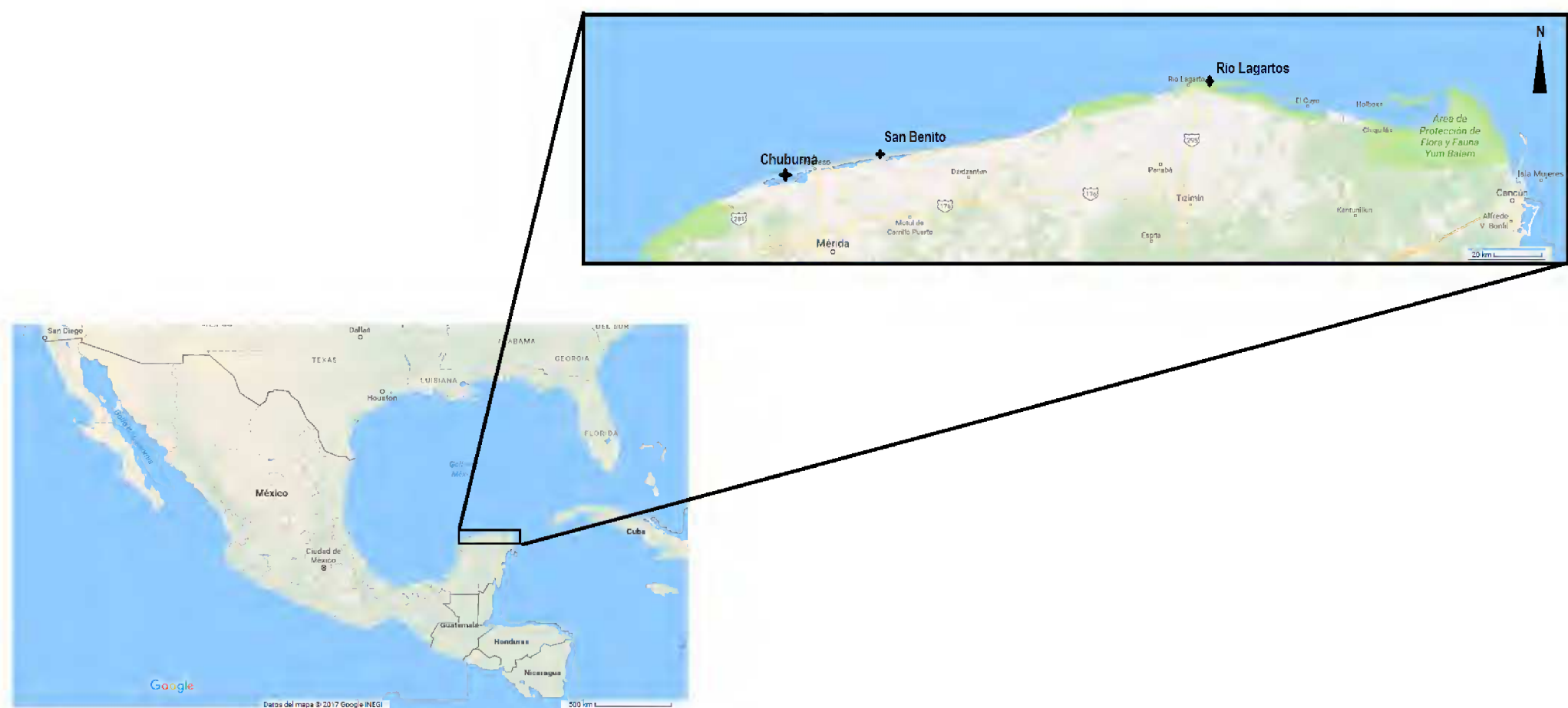
Figura 1: Localización de los sitios de estudio (Chuburná, San Benito y Río Lagartos) en la costa de Yucatán, México.

En cada cuadrante se tomó una muestra de 100 cm 3 de los primeros 5 cm de suelo, utilizando cilindros de PVC de 5.08 cm de diámetro y 5 cm de largo; no se incluyó el mantillo superficial en la muestra. Las muestras de suelos se secaron a temperatura ambiente hasta peso constante,